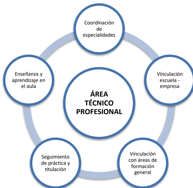
Esquema N° 5: Área Técnico - Profesional.

Quien asume el liderazgo de esta área es el coordinador técnico – profesional, quien trabaja con un equipo compuesto por las personas responsables de las tareas que se indican en el esquema N° 5: