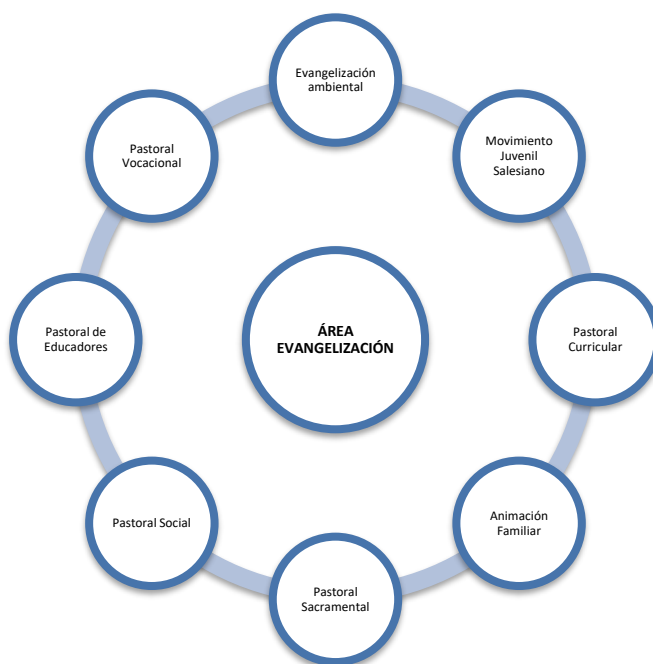
Esquema N° 6: Área de Evangelización.

Quien asume el liderazgo de esta área es el coordinador pastoral, quien trabaja con un equipo compuesto por las personas responsables de estos ámbitos de misión que se indican en el esquema N° 15: