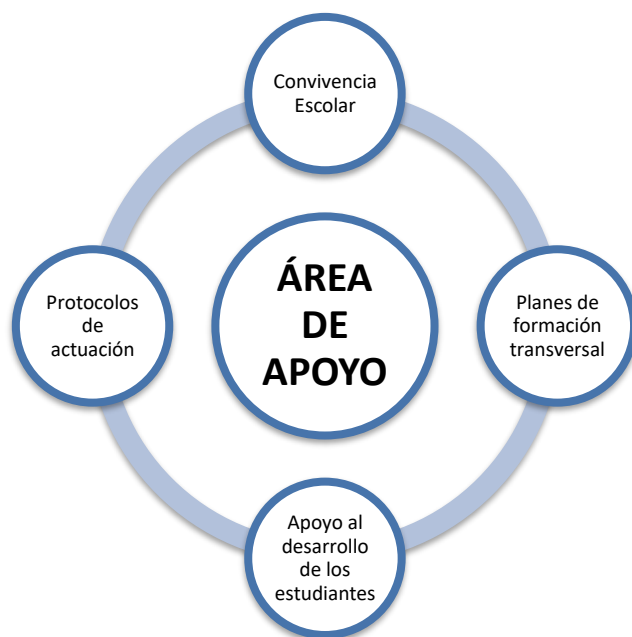
Esquema N° 8: Área de Apoyo (acompañamiento).

Quien asume el liderazgo de esta área es el coordinador del equipo de apoyo, quien trabaja con un equipo compuesto por las personas responsables de las tareas que se indican en el esquema N° 8: