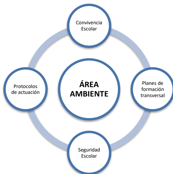
Esquema N° 7: Área de Ambiente

Quien asume el liderazgo de esta área es el coordinador de ambiente, quien trabaja con un equipo compuesto por las personas responsables de las tareas que se indican en el esquema N° 7: